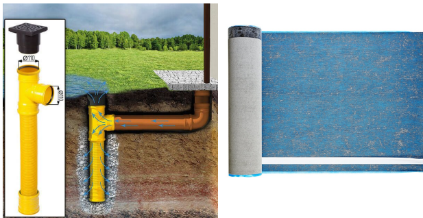
Sickerschacht mit Zufluss/Abfluss Ø 110 mm