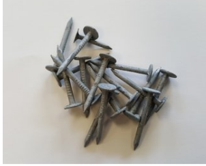
Dachpappennägel (Breitkopfst.) 25/25 verzinkt