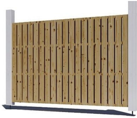
Seitenwand für Carport