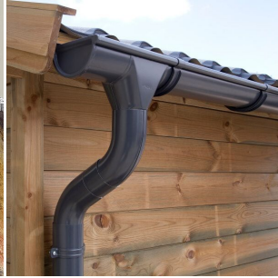
Dachrinnenset Zink Dachrinne für Pultdach bis 8,5 m