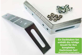
Dachhaken Set für PVC | Satteldach

Ein Dachhaken-Set enthält die richtige Anzahl für Ihre kompletten Dachrinnen Set! 100% umweltfreundliches Material