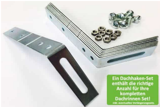
Dachhaken Set für PVC | Satteldach

Ein Dachhaken-Set enthält die richtige Anzahl für Ihre kompletten Dachrinnen Set! 100% umweltfreundliches Material