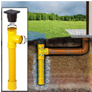
Sickerschacht mit Zufluss/Abfluss Ø 110 mm