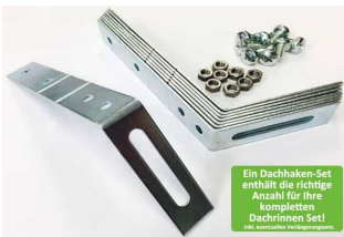
Dachhaken Set für PVC | Satteldach