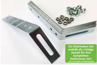
Dachhaken Set für PVC | Satteldach

Ein Dachhaken-Set enthält die richtige Anzahl für Ihre kompletten Dachrinnen Set! 100% umweltfreundliches Material