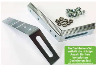
Dachhaken Set für PVC | Satteldach