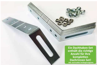
Dachhaken Set für PVC | Satteldach

Ein Dachhaken-Set enthält die richtige Anzahl für Ihre kompletten Dachrinnen Set! 100% österreichische Herstellung