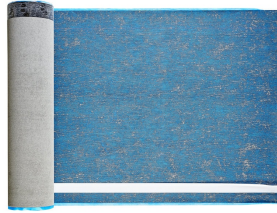
Villasub E-KV-15 SK Schalungsbahn 20 m 2