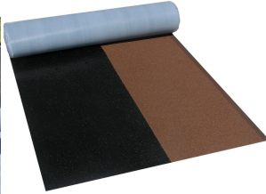
Villas DichtDach Contur 24 m 2