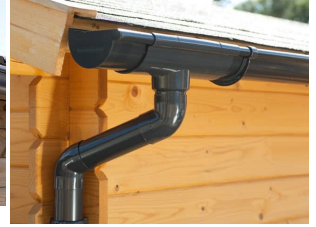
PVC Dachrinnen für Pulldach bis 5,25 m