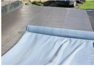
ONDULINE KSK BAHN 5 Rollen