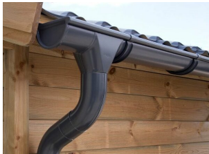
Dachrinnenset Zink für Satteldach bis 6,8 m