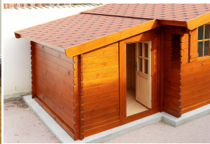
Anbau Werkzeugschuppen - 161 x 273 cm