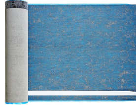
Villasub E-KV-15 SK Schalungsbahn 60 m 2