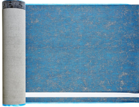
Villasub E-KV-15 SK Schalungsbahn 40 m 2