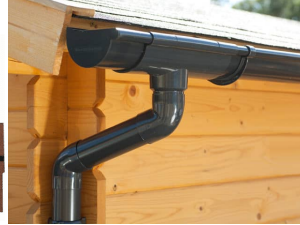
PVC Dachrinnen für Satteldach bis 8,75 m