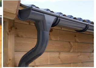
Dachrinnenset Zink für Satteldach bis 6,8 m