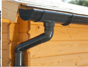
PVC Dachrinnen für Pulldach bis 5,25 m