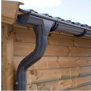
Dachrinnenset Zink für Satteldach bis 8,5 m