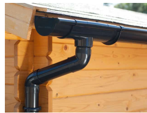
PVC Dachrinnen für Satteldach bis 4,5 m