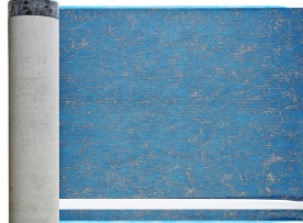
Villasub E-KV-15 SK Schalungsbahn 20 m 2