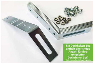
Dachhaken Set für PVC | Satteldach