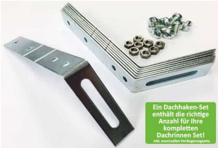
Dachhaken Set für PVC | Satteldach