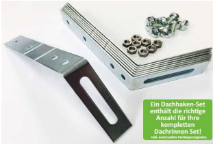
Ein Dachhaken-Set enthält die richtige Anzahl für Ihre kompletten Dachrinnen Set!